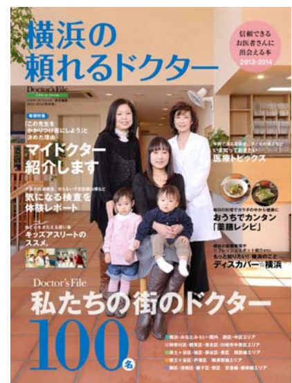
横浜の頼れるドクター Vol.1 2013年3月2日発売