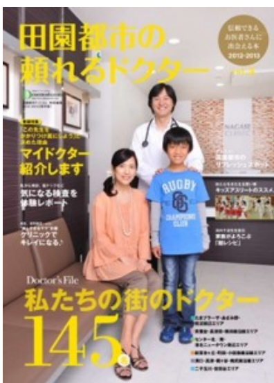
田園都市線の頼れるドクター Vol.5 2012年8月31日発売