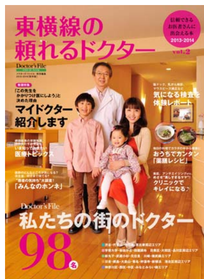
東横線の頼れるドクター Vol.3 2013年3月2日発売