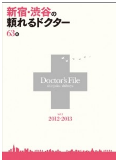
新宿・渋谷の頼れるドクター Vol.1 2012年11月24日発売